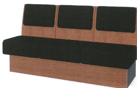
<天童木工を使用したソファ>