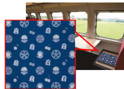
<天童将棋駒等をデザインした座布団>