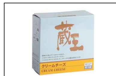
蔵王町「クリームチーズ」

旬である初夏に獲れた身の厚いほやを使用。ほや本来の旨味と香りを生かし食べやすくあっさりとした塩辛です。