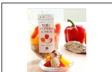
南三陸町「牡蠣ピクルス」

宮城県産の濃厚なカキとシャキシャキのパプリカを使用。牡蠣のエキスがたっぷりて食欲をそそる一品です。