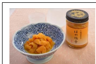
気仙沼市「ほや塩辛」

宮城県産の濃厚なカキとシャキシャキのパプリカを使用。牡蠣のエキスがたっぷりて食欲をそそる一品です。