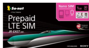
SIM カードパッケージデザイン