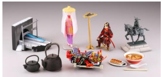
新・日本みやげ「LuckyDrop」カプセルフィギュア