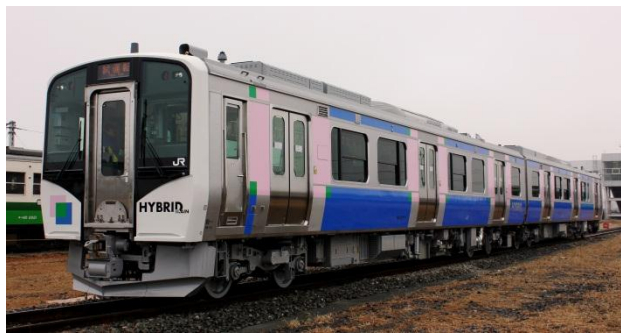
【HB-E210 系 ディーゼルハイブリッド車両】