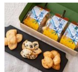
【青唐辛子・のり・ざらめ 3種類】