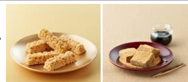
【仙台きなこクランチ・黒蜜きなこもち】