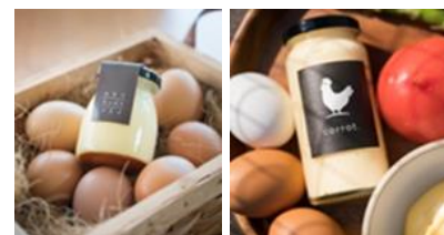
【プリン・マヨネーズ】