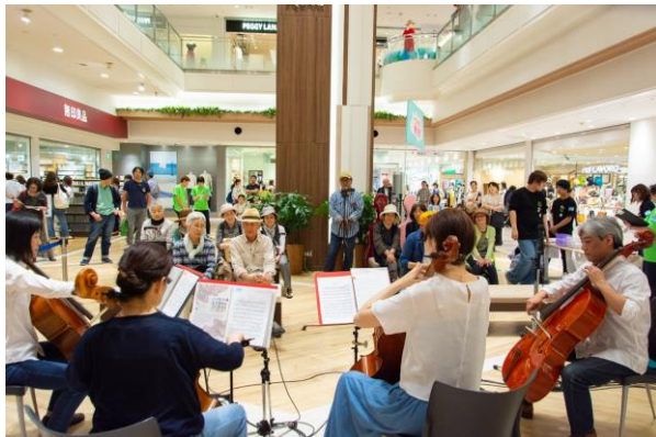
【エスパル仙台本館 1階 エスパル仙台スクエア】