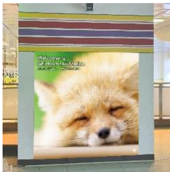
< 改札内コンコース >

白石蔵王駅に来駅していただいた記念として、SNSなどで発信できるよう、改札内にフォトスポットを設置しました。