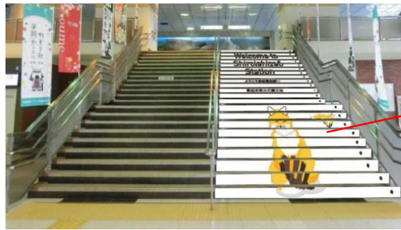
< 改札内階段 >