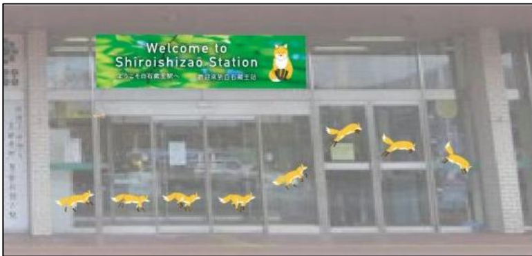
< 駅舎入口（西口） >