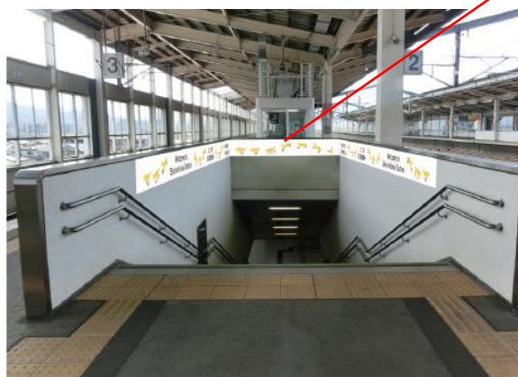
< 1・2 番線 階段部分 >