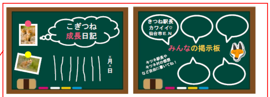
< 駅社員情報発信ボード > < 来駅者コミュニケーションボード >