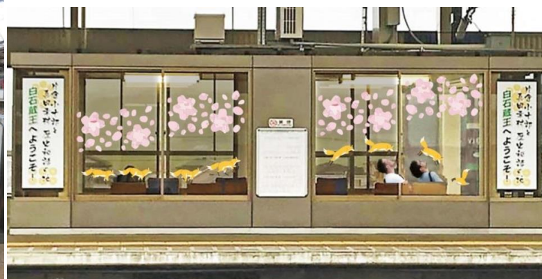
< 1・2 番線 ホーム待合室 >