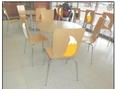
< 改札外 待合室椅子 >