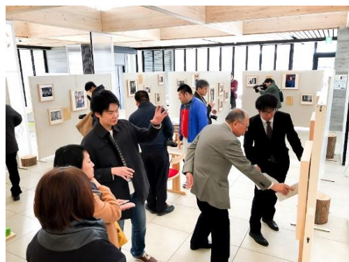
※南三陸町での開催風景