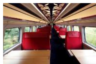
お座敷指定席 (イメージ)