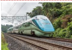
とれいゆ つばさ(イメージ)

「新幹線初のリゾート列車」として 2014 年 7 月から運行を開始し、車内には畳の「お座敷指定席」や車窓を眺めながら寛げる「足湯」を設定しています。