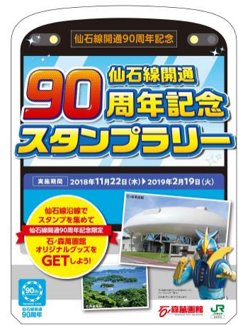
スタンプラリー台紙 (イメージ)

※詳しい実施内容は、11月20日頃に配布予定のスタンプラリー台紙をご覧ください。