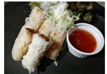
海鮮網春巻き スイートチリソース 500円 (税込) 海鮮のすり身をネットライス ペーパーに包み揚げ。