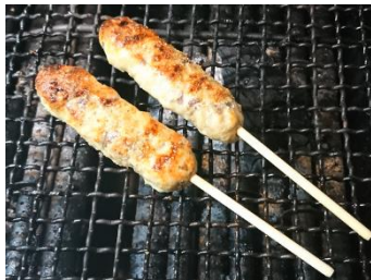
牛たんつくね串 炭火焼き (2本) 500円 (税込) 定番にして不動の人気メニュー。 ビールとの相性も抜群!