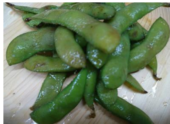
仙台茶豆の 石巻アンチョビ和え 500円 (税込) 仙台ブランドの茶豆を 贅沢に使用しました。