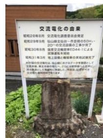
〈作並駅 交流電化発祥地の碑〉

それ以前は、作並～山寺間は仙山トンネル（奥新川～山寺駅間）における SL の ばいえん 煤煙対策等により、先に直流電化されていきました。作並駅を基地として、交流電気機関車の試験が北仙台～作並駅間で実施されました。交流電化の発展は、大出力・高速で走る新幹線の開発を成功に導いた土台となる技術と言えます。