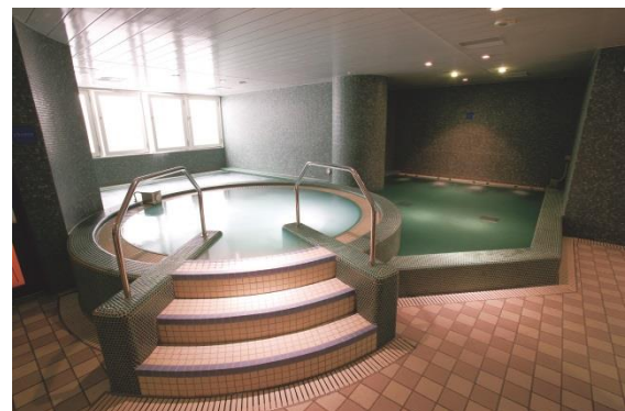
スパ（ジェクサー・フィットネス&スパ 上野）