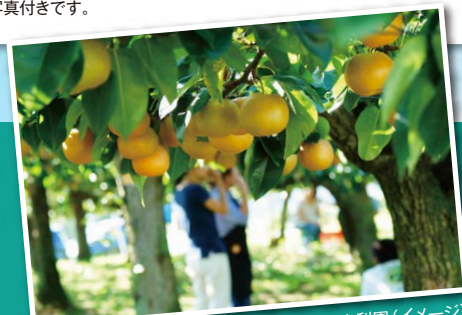
観光梨園(イメージ)