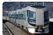
東武鉄道特急リパティ