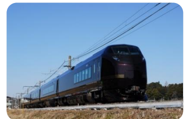
E655系「なごみ」イメージ