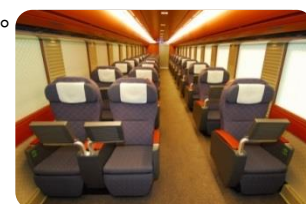
E655系「なごみ」車内(イメージ)