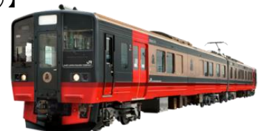
フルーティアふくしま（イメージ）