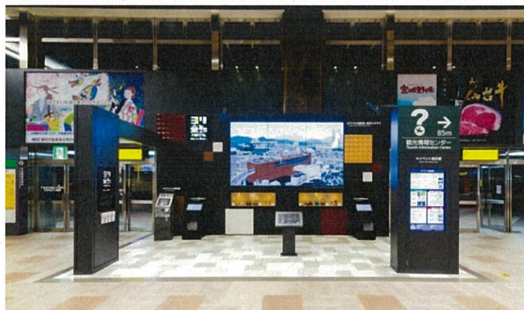
ヨリ未知ポータル全景写真

2016年7月、仙台駅2階コンコースに設置された体感型情報発信拠点です。165インチ大型モニターでは、デジタル版鉄道・観光ジオラマや、最新の音響技術による臨場感あふれる映像をご覧いただけるとともに、東北の伝統工芸品の展示等も行っています。