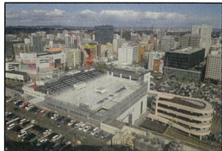
放映イメージ画像

仙台駅リニューアル2周年を記念し、仙台駅、エスパル仙台、ホテルメトロポリタン仙台等の昔の写真から、仙台駅のリニューアルにより各種新館が建設され、現在に至るまでの変遷を放映します。