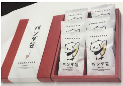
株式会社及善商店 「パンダ笹かまぼこ」