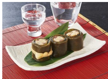
有限会社橋本水産食品 「さんまの昆布巻き」