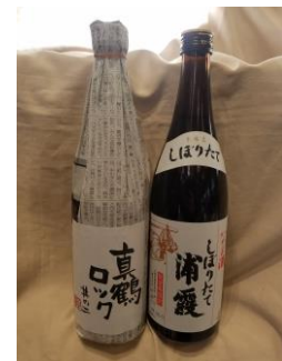
株式会社むとう屋 「真鶴ロック」「しほりたて浦霞」