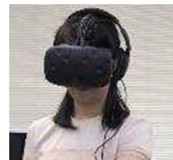
VRゴーグル着用イメージ

「5 G（第5世代移動通信システム）」を活用し、VR（バーチャルリアリティ）により上野駅にいなながら「南三陸さんさん商店街」でショッピングを行っていただけるような体験ができます。