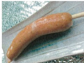
仙台名物 牛タン入りフランク 500円(税込) 定番にして不動の人気メニュー、 牛タンを食べやすくしました。