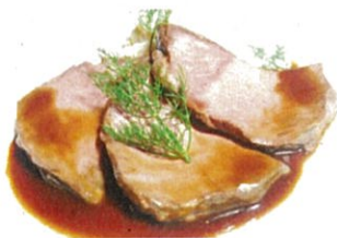
仙台黒毛和牛ローストビーフの グリル 800円(税込) 程よく脂がのった、上質な 黒毛和牛を厳選使用しました。