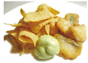
フィッシュアンドチップス (ずんだディップ付) 400円(税込) 仙台名物ずんだの新しい 楽しみ方です。