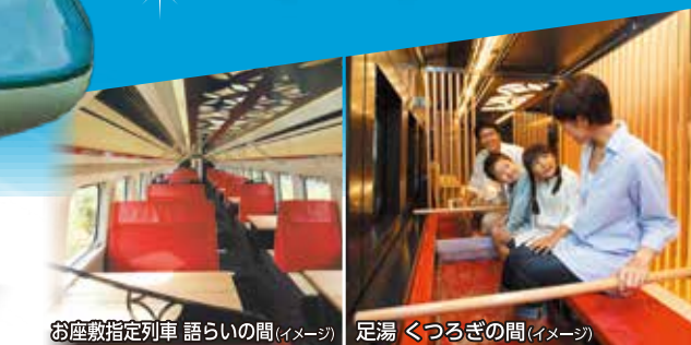
お座敷指定列車 語らいの間(イメージ)