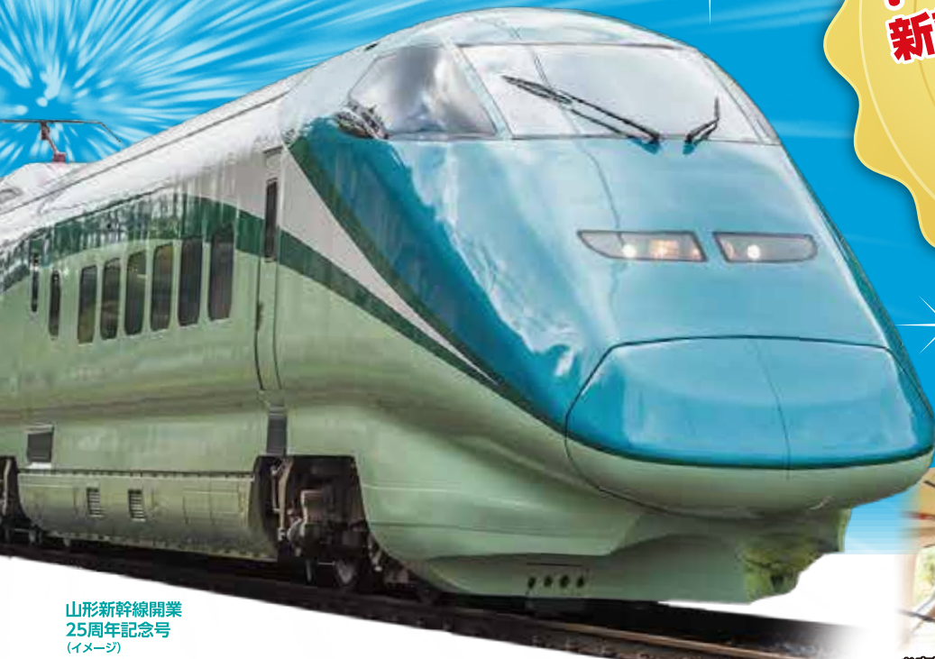
山形新幹線開業 25周年記念号 (イメージ)