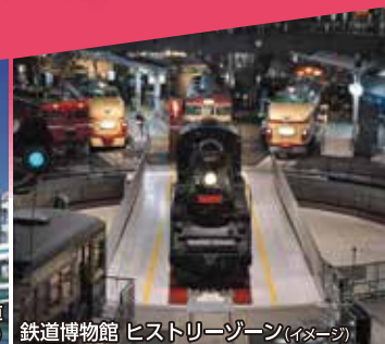
鉄道博物館 ヒストリーゾーン (イメージ)