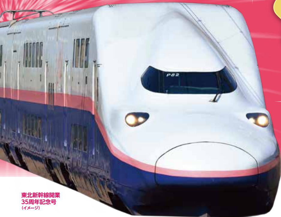
東北新幹線開業 35周年記念号 (イメージ)