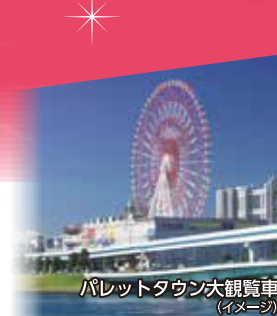
パレットタウン大観覧車 (イメージ)