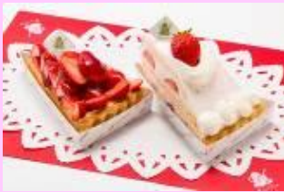
「いちご」を使用したスイーツ 5月中旬ごろまで