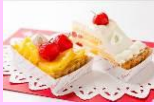
「さくらんぼ」を使用したスイーツ 5月下旬ごろ～