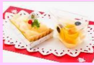
「桃」を使用したスイーツ 7月上旬ごろ～