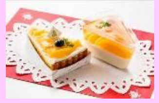
「黄金桃」を使用したスイーツ 9月上旬ごろ～

※「いちご」を使用したスイーツ（5月中旬ごろまでの提供を予定）については、2017年3月よりご提供中のスイーツですが、5月下旬ごろからの提供を予定している「さくらんぼ」を使用したスイーツ以降は2016年度の提供例であり、実際にご提供するスイーツとは異なります。