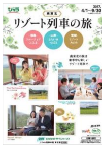
「リゾート列車の旅」 (表紙イメージ)