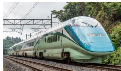
とれいゆ つばさ (イメージ)

「南東北」パンフレットでも「のってたのしい列車」利用の旅行商品をご紹介します。(発売中)