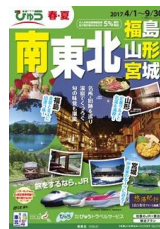
「南東北」 (表紙イメージ)