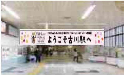
横断幕掲出(改札内)