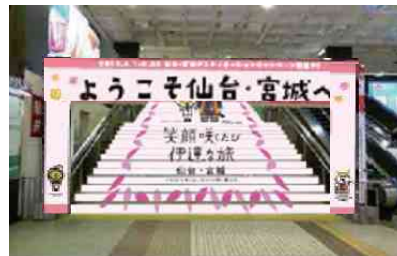
【2階中央改札前コンコース】 階段装飾・アーチ設置