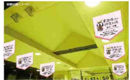
ミニフラッグ掲出