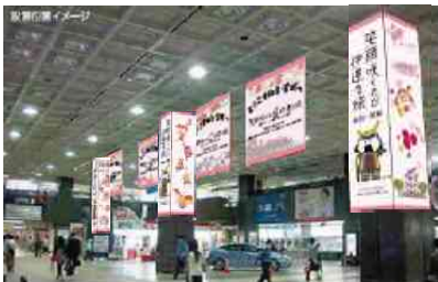
【2階中央改札前コンコース】 柱巻き装飾・大型フラッグ掲出