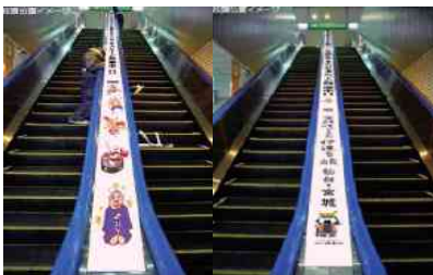
新幹線中央口・南口コンコース内 エスカレーター間ステッカーの装飾