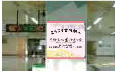
柱への歓迎メッセージ看板掲出