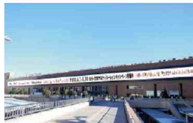
4階新幹線ホームガラス面 (横幅約 200m)装飾