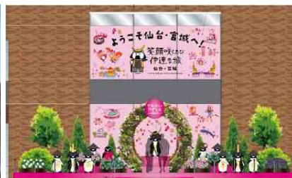
2階ペデビジョン前 Suica のペンギン