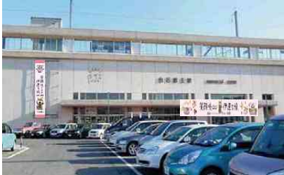
懸垂幕・横断幕掲出(屋外)

「新幹線ホームガラス面」の装飾については3月23日(土)に施工を完了しております。