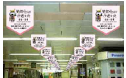
【2階中央改札前・3階みどりの窓口前コンコース】 ミニフラッグ掲出