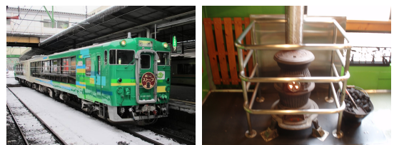
〔風っこ車両・ダルマストーブのイメージ〕